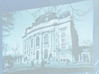
СУ, сградата на ректората, 1934 г.