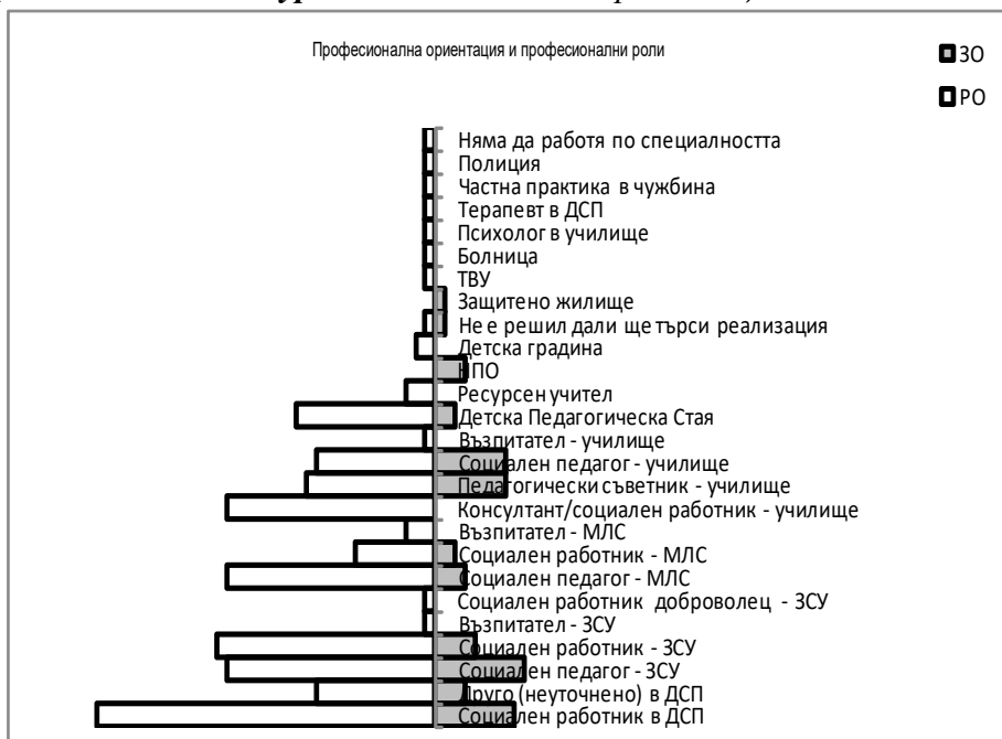
Фигура 2. Мотиви за избор на специалност

За по-голяма прегледност, макар и не толкова информативно, данните от проучването могат да се представят и обобщено по посочената от студентите бъдеща месторабота (фиг. 3).