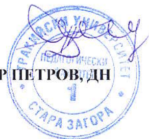
ГРАФИК ЗА ПРОВЕЖДАНЕ НА ДЪРЖАВНИ ИЗПИТИ – РЕДОВНА СЕСИЯ, учебна 2016/2017 година